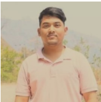
अनुवादक : निशान्त ढुंगाना

आर्थिक स्वतन्त्रता र वातावरणीय मापदण्डहरू बीच स्पष्ट सम्बन्ध छ । आर्थिक स्वतन्त्रता सूचकाङ्कको वातावरणीय सूचकाङ्कसंग तुलना गर्दा पुँजीवादी मुलुकहरूमा वातावरणको अवस्था राम्रो देखिन्छ।